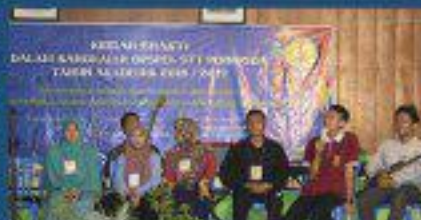
Kemah Bhakti di Desa Ngluyu