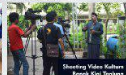
Shooting Video Kulture Bepok Kiai Tanjung