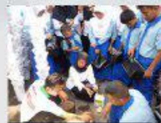
Pelatihan Pemanfaatan Lahan Selo