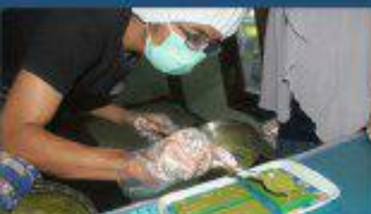
Produk Unggulan Mahasiswa (Moringa Chocolate)