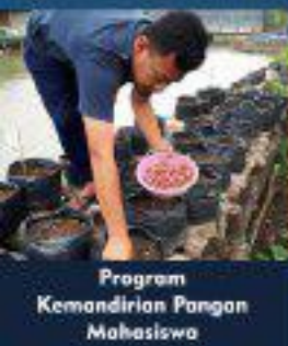
Program Kemandirian Pangan Mahasiswa