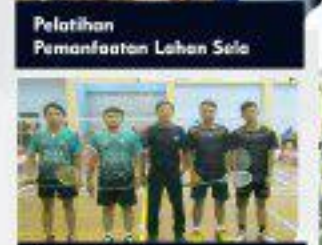
Pertandingan Bulu Tangkis Tingkat Provinsi