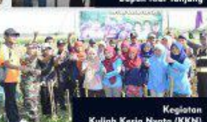
Kegiatan Kuliah Kerja Nyata (KKN)