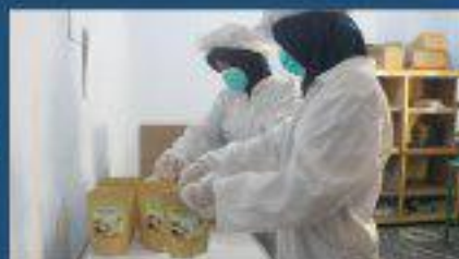
Praktikum Industri di Lab. Proses Produksi