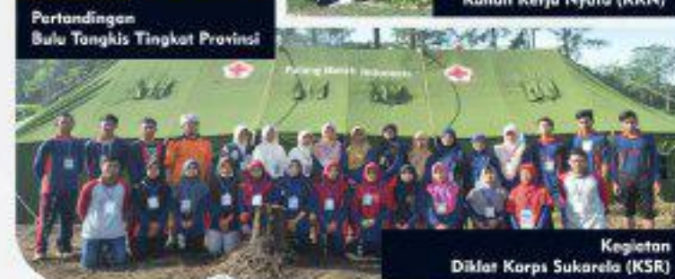
Kegiatan Diklat Korps Sukarela (KSR)