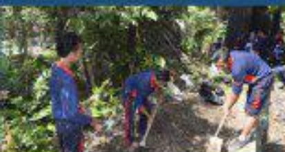
Baksos dengan Karang Taruna Desa Ngluyu