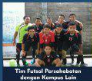
Tim Futsal Persahabatan dengan Kampus Lain